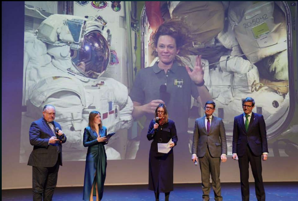
Instante de la conexión en directo con la Estación Espacial Internacional