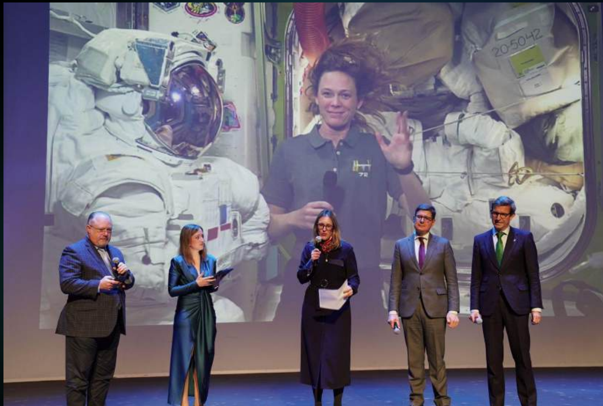
Instante de la conexión en directo con la Estación Espacial Internacional